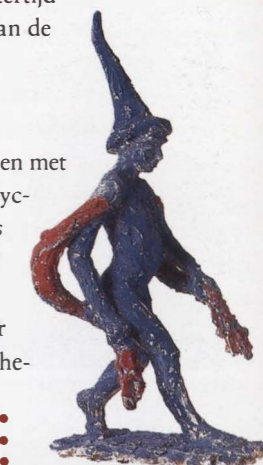
Blauwe vogel, 1984