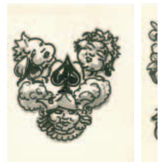
Alfred Ost, ontwerpen voor speelkaarten, zonder datum