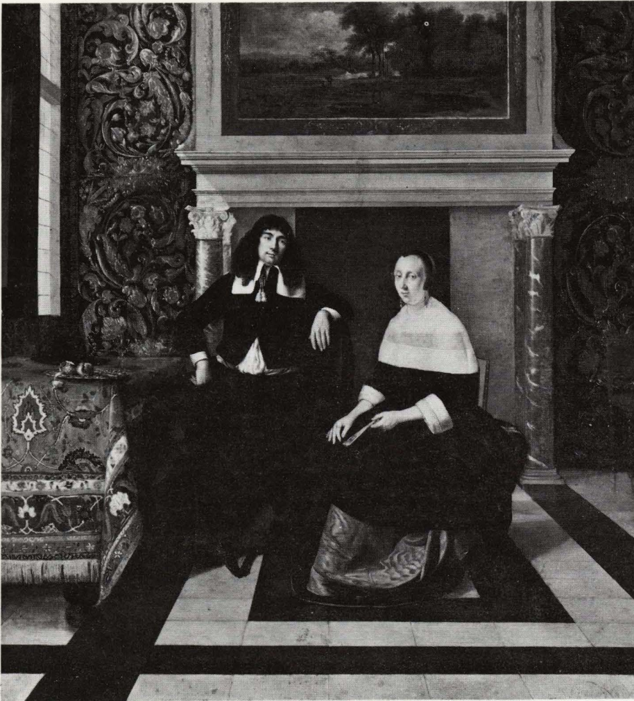
Eglon Hendrik van der Neer, Echtpaar in voornaam interieur, Museum of Fine Arts, Boston