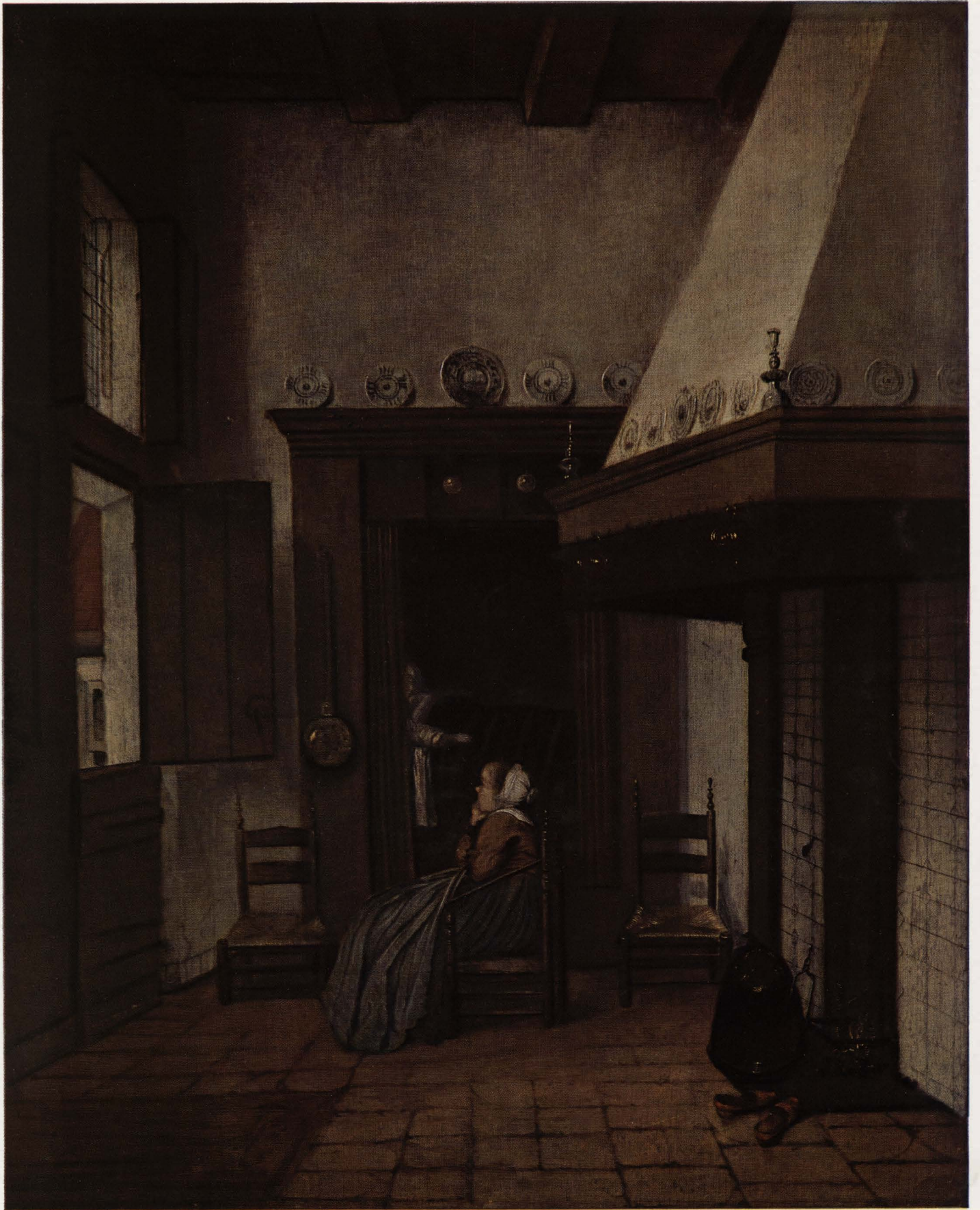
Okb jan/maart 1973