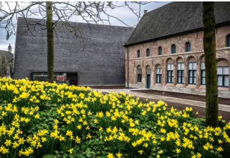
Abby, Kortrijk