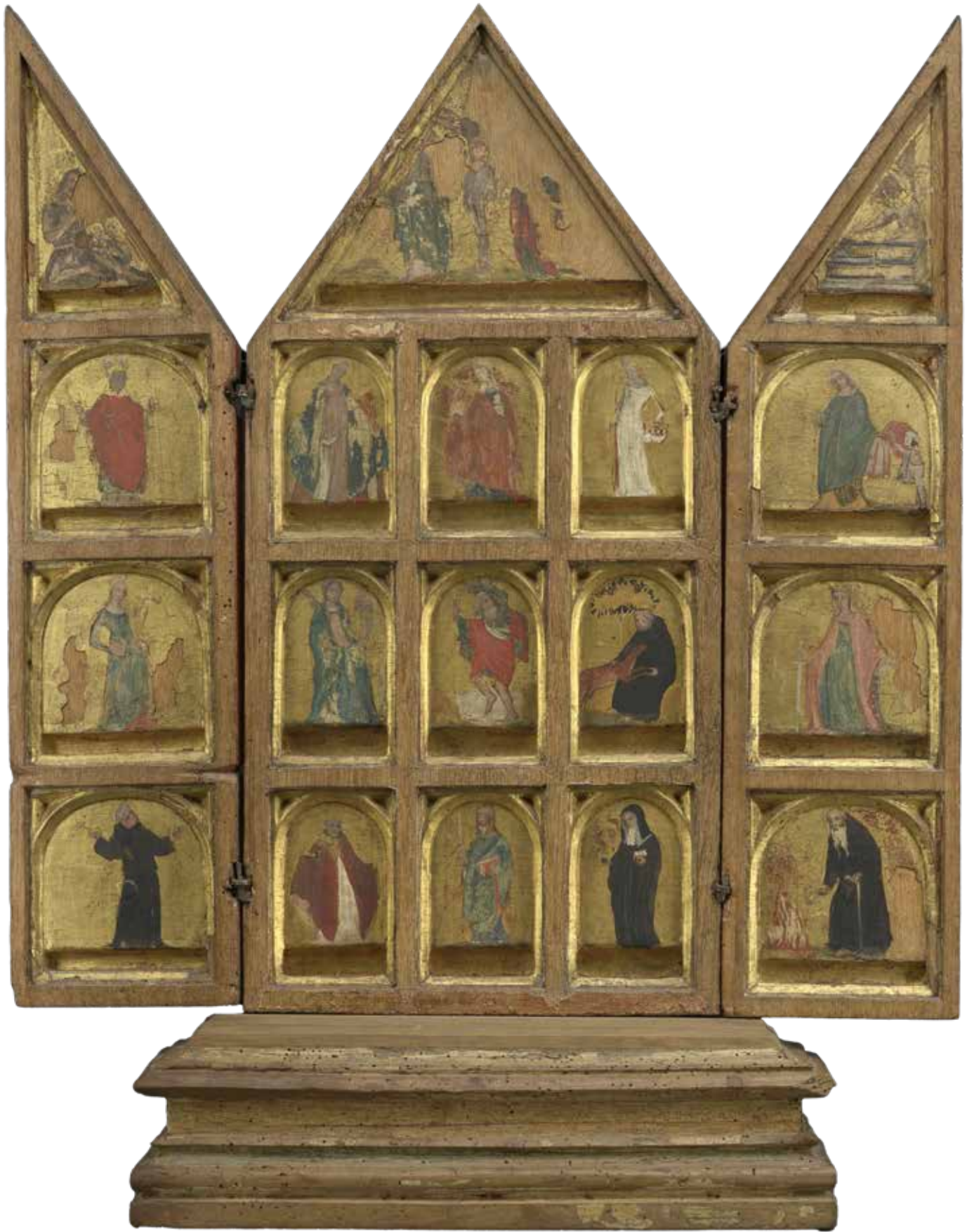
Anoniem, Drieluik met Calvarie en 15 heiligen, ca. 1400-1410, olieverf op paneel, Hof van Busleyden, Mechelen