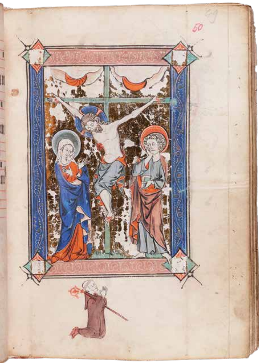
Anoniem, Rituale cisterciense , veertiende eeuw, perkament, 21 x 15 cm, Grootseminarie, Brugge

de dodenliturgie. De priester kreeg niet alleen de gebeden aangereikt, maar ook een partituur als houvast. Wie bereidde het perkament voor, wie componeerde de bladspiegel, wie schilderde urenlang aan de afbeeldingen? Het boekje berust nu in de bibliotheek van het Grootseminarie in Brugge.