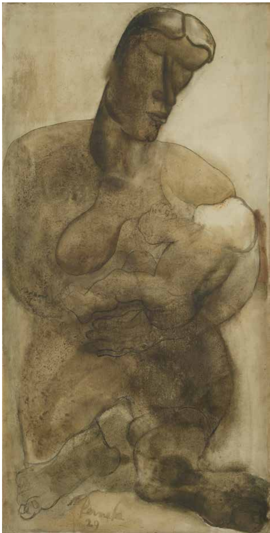
Constant Permeke, Moederschap , 1929, olieverf en houtskool op doek, 180 x 90 cm, Permekemuseum Jabbeke | Mu.ZEE Oostende, foto: Steven Decroos

Terwijl Permeke op een onverminderd tempo bleef werken, hadden de dolle en euforische jaren twintig plaatsgemaakt