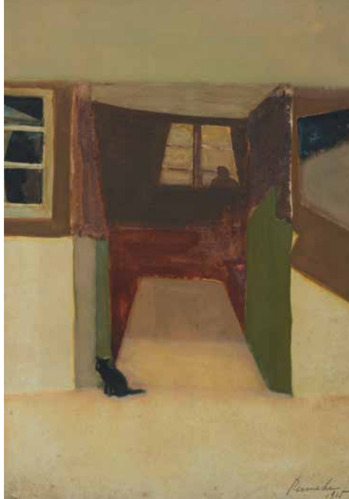
Constant Permeke, Zijn huis in Stanton Saint-Bernard , 1915, aquarel op papier, 35 x 24,5 cm, Permekemuseum Jabbeke | Mu.ZEE Oostende

doeken ademen een gespannen sfeer, hebben een psychologische dimensie die Permeke in de komende jaren verder zou ontwikkelen.