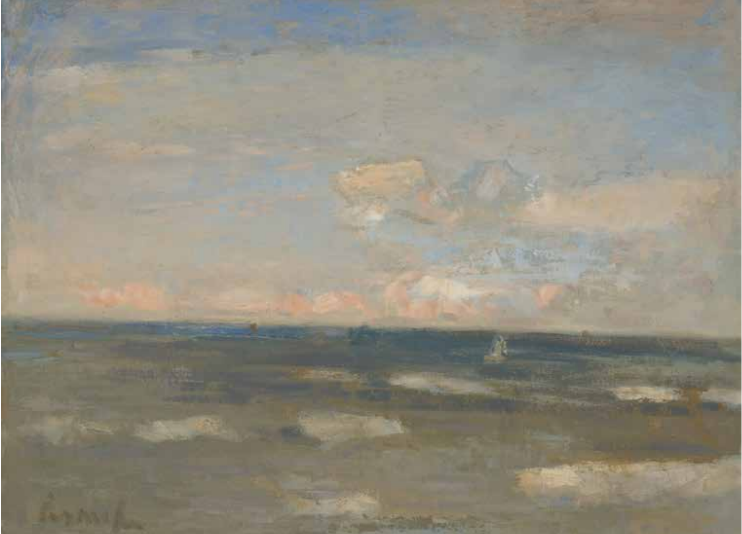
Constant Permeke, Blauwe marine , 1947, olieverf op doek, 100 x 130 cm, Permekemuseum Jabbeke | Mu.ZEE Oostende, foto: Cedric Verhelst

ste Wereldoorlog terecht in een tehuis voor vluchtelingen in de Oostendse Visserswijk, achter de vuurtoren. Achiel Stubbe, een vriend des huizes en de eerste die al in 1930 een monografie over Permeke publiceerde, schreef: "Met zijn vrouw en kinderen bewoonde hij (...) een schamel huisje en wrocht in een kamertje te gering van afmetingen om er zijn grootscheepse doeken onder dak te brengen, zodat hij meestal buiten huis bedrijvig was. Daar ontstonden toen de eerste meesterwerken van uitdrukkelijk expressionistische beelding." Het huis in Jabbeke daarentegen is gebouwd met schilderen, tekenen en beeldhouwen als leidraad, en zelfs de tuin en de velden bij het huis lijken er speciaal neergelegd als decor voor zijn doeken.