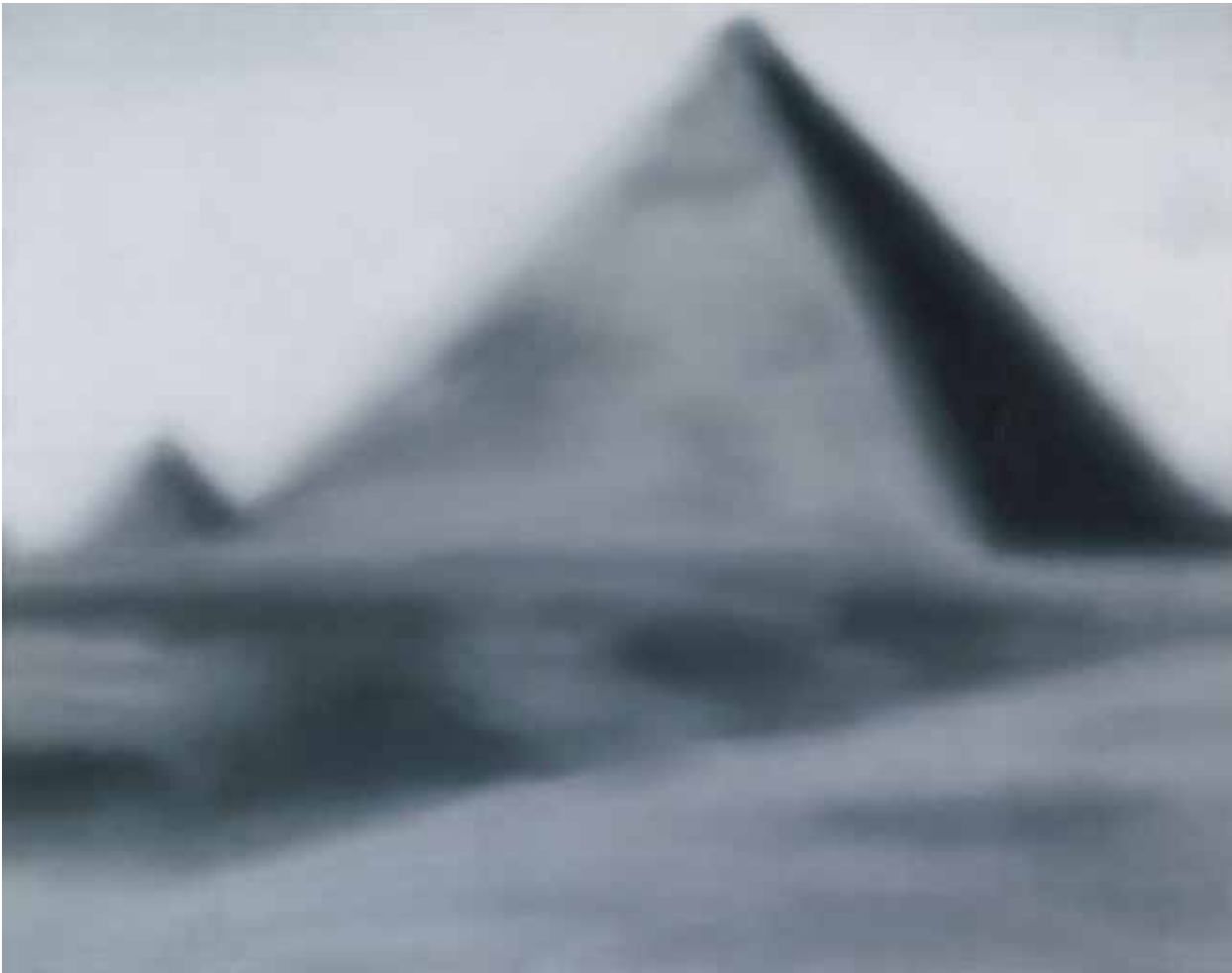
Gerhard Richter, Große Pyramide , 1966, olieverf op doek, 190,3 x 240,3 cm, S.M.A.K., Gent