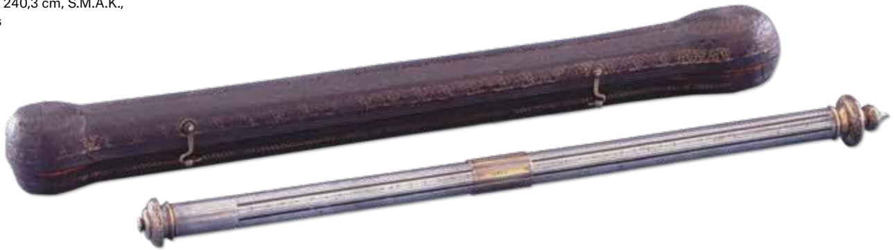
Wenzel Jamnitzer, Maatstaf voor de gewichtsvergelijking van verschillende metalen met foedraal , 1565, leer, verguld zilver, zilver, 42 x 2,8 cm, Museum Mayer van den Bergh, Antwerpen, foto: Michel Wuyts

van musicoloog en dirigent Jan Caeyers (1953) al enige tijd vaste voet aan de grond heeft. Zijn wetenschappelijke biografie, inmiddels in meerdere vertalingen uitgebracht, is hét referentiewerk over Beethoven.