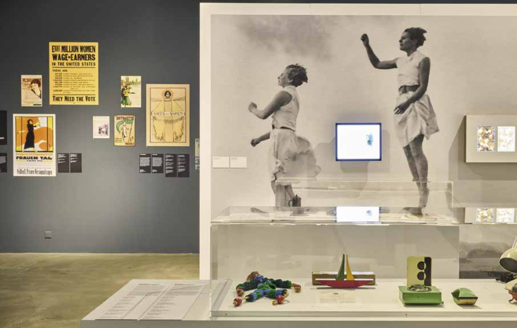
Here We Are! Women in Design, 1900 - Today