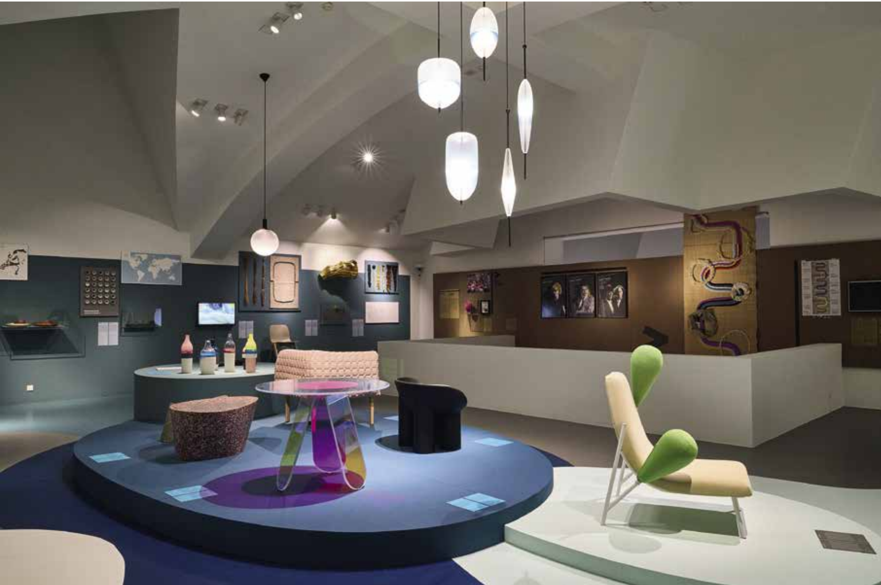
Here We Are! Women in Design, 1900 - Today

INFO Here We Are! Women in Design, 1900-Today – Nog tot 9 maart – Untold Stories - Vrouwelijke ontwerpers in België, 1880-1980 – Nog tot 13 april – Open: elke dag van 11 tot 19 uur – Design Museum Brussels, Belgiëplein, 1020 Brussel – T 02 669 49 29 – designmuseum.brussels ARCHIEF Artikel Vrouwenstreken : OKV 2011, nr. 1, blz. 31 – Thema Het penseel in vrouwenhanden : OKV 2016, nr. 2 – okv.be/tijdschrift