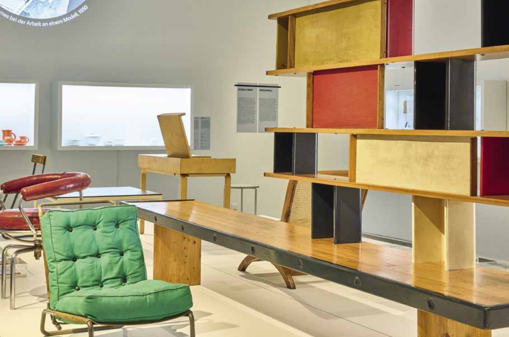
Here We Are! Women in Design, 1900 - Today