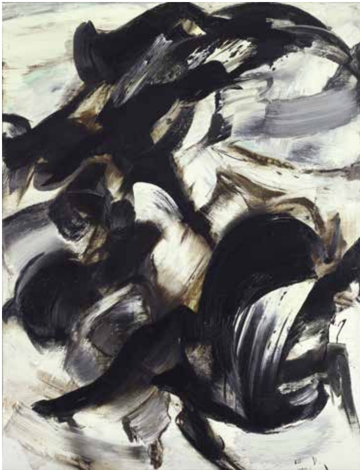
Englebert Van Anderlecht, Le grand noir , 1960, olieverf op doek, 160 x 122 cm, S.M.A.K., Gent © SABAM Belgium 2024

Kunst in Vlaanderen van Michel Seuphor voor een eerste referentieboek. Vijf jaar later ging zelfs Walther Vanbeselaere, de starre directeur van het KMSKA die bij het Vlaamse expressivisme zweerde, overstag met de expositie Kontrasten 47/67 . In dat overzicht van naoorlogse kunst bleek een derde abstract.