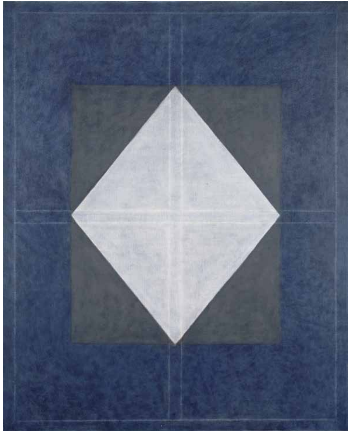
Dan Van Severen, Blauwe Compositie , 1969, olieverf op doek, 162 x 130 cm, S.M.A.K., Gent © SABAM Belgium 2024

uit 1965. Hoewel het werk zelf statisch is, verandert het voortdurend, naargelang de lichtinval en de positie van de toeschouwer.