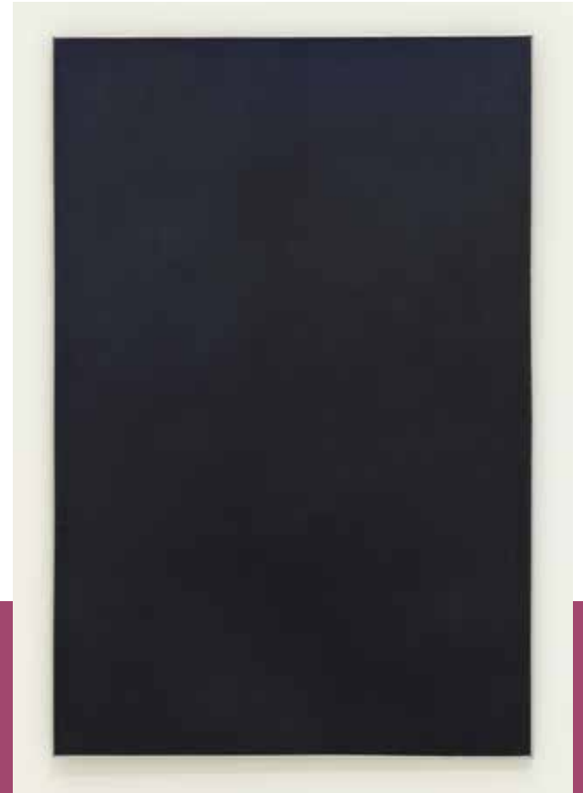
Jef Verheyen, Zwarte ruimte - Bonjour Héraclite , 1959, acrylverf op doek, 194,1 x 128,8 cm, Koninklijk Museum voor Schone Kunsten, Antwerpen © www.artinlanders.be Foto: Rik Klein Gotink © SABAM Belgium 2024