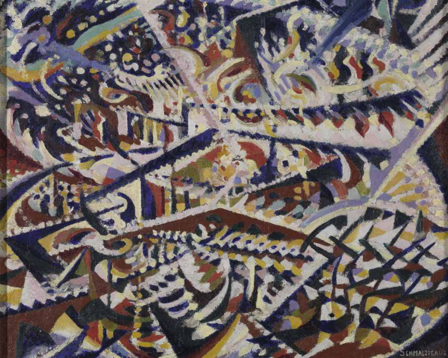
Jules Schmalzigaug, Licht + Spiegels en Menigte: interieur van een populaire balzaal in Antwerpen , 1914, olieverf op doek, Koninklijk Museum voor Schone Kunsten, Antwerpen

Licht + Spiegels en Menigte was een van de zes schilderijen die Schmalzigaug inzond voor de internationale futuristische tentoonstelling in Rome in april 1914. Daar hing ook Ontwikkeling van een thema in rood: Carnaval . Van dit werk was er geen spoor tot het eind 2015 plots opdook op een veiling in Zürich. Via kunsthandelaar Ronny Van de Velde kon de Vlaamse gemeenschap het verwerven voor het KMSKA. Het herontdekte topstuk kan beschouwd worden als het eerste volledig abstracte werk van een Belgische kunstenaar. Hoewel de titel nog een verwijzing naar een feest bevat, is het een pure kleurenimprovisatie.