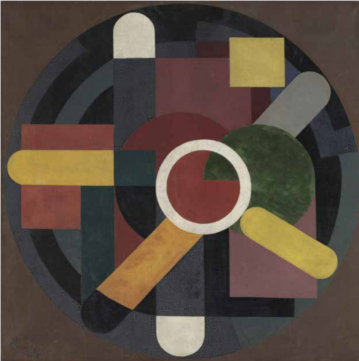
Jozef Peeters, Compositie , 1921, olieverf op doek, 150 x 150 cm, Koninklijk Museum voor Schone Kunsten, Antwerpen © www.artinflanders.be Foto: Hugo Maertens © SABAM Belgium 2024

ren. Met dergelijke studies bracht Vantongerloo zijn eigen kleurentheorie in praktijk. In tegenstelling tot zijn vriend Mondriaan die alleen primaire kleuren gebruikte, ontwikkelde hij een systeem van zeven hoofdkleuren en vijf overgangskleuren. Hij zag het als een plastisch twaalftoonstelsel waarmee hij diepte, reliëf en effecten kon uitdrukken. Later in zijn carrière zou hij krommen toelaten in zijn doeken en als beeldhouwer experimenteren met nieuwe materialen als plastic en plexiglas, zoals in Zonbanen , een zon van onze melkweg met twee van haar planeten, een speels topstuk uit 1963 dat het Brugse Groeningemuseum verwierf.