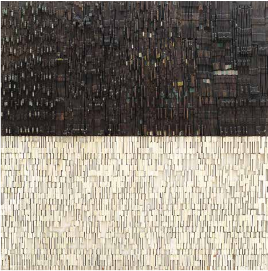
Vic Gentils, Toccata en fuga , 1963-65, mixed media, 244,5 x 250 x 15 cm, S.M.A.K., Gent © SABAM Belgium 2024