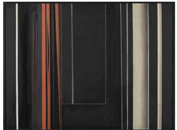
Luc Peire, Manolete , 1957, olieverf op doek, 97,7 x 130 cm, Musea Brugge © www.artinflanders.be Foto: Dominique Provost © SABAM Belgium 2024

Walter Leblanc (1932-1986) vond dan weer aansluiting bij de optische en kinetische kunst. Vanaf zijn lidmaatschap van G58 experimenteerde hij met materieschilderijen met gekleefde draden. De stap naar driedimensionale reliëfs volgde. Vooral zijn Torsions Mobilo-Static met gedraaide polyvinylinten werden in het buitenland goed ontvangen. Het S.M.A.K. bezit een topstuk