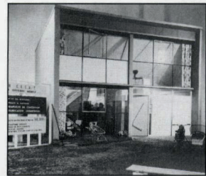
Het CECA-huis van architect Willy Van Der Meeren op de Luikse Internationale bouwbeurs in 1954

Willy Van Der Meeren heeft veertig jaar lang met een ongewone inventiviteit velerlei vormen van beschutting ontworpen: een huis op wielen, een huis als een bouwdoos, een huis in gewapend beton, daken van triplex, van gewapend polyester, plafonds van polyurethaan opgehangen als waren