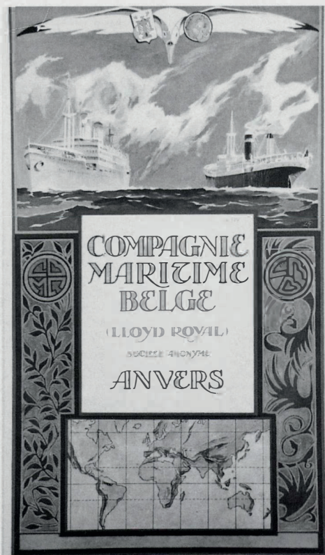
Kalender uit 1930 van de Compagnie Maritime Belge. Nationaal Scheepvaartmuseum.