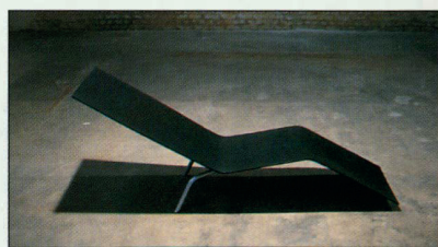
"Chaise Longue", Maarten van Severen.

Het nieuwste ontwerp van Maarten van Severen "Chaise Longue" is goed voor de Prijs van het Beste Product . Het is een liggzetel uit polyester, versterkt met glasvezel en aluminium. Uit de 64 kandidaten voor deze prijs werden er 13 geselecteerd voor de tentoonstelling.