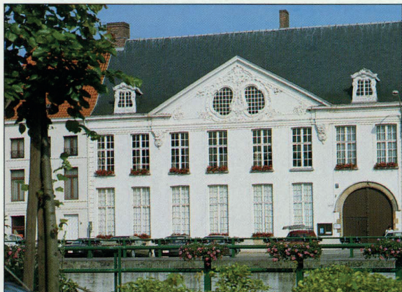
Aan de overkant van de Schelde in Oudenaarde schittert het Huis de Lalaing.