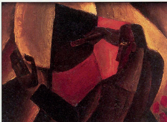
FRITS VAN DEN BERGHE, DE ZONNESCHILDER, 1921 (DETAIL) OLIEVERF OP DOEK