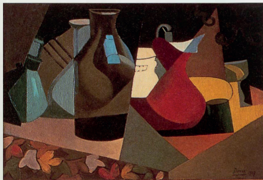
MARTHE DONAS, STILLEVEN, 1917 35,5 X 53 CM KONINKLIJK MUSEUM VOOR SCHONE KUNSTEN ANTWERPEN

Van 15de-eeuws miniaturen tot en met werken uit de vroege 20ste-eeuwse avant-garde: 'Elck zijn waerom' wil laten zien hoe vrouwelijke kunstenaars doorheen de jaren hun talenten ontplooiën en een 'besloten hof' aanleggen waar jarenlang een 'terra incognita' lag.