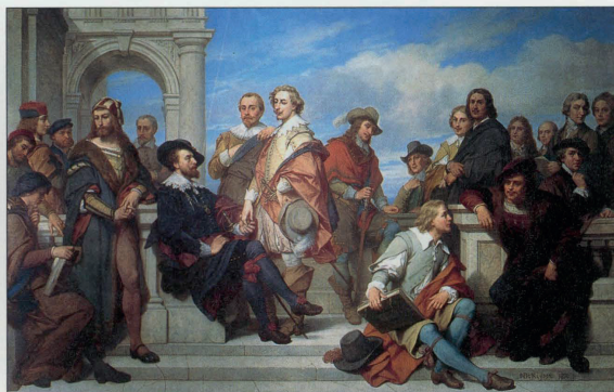
NICAISE DE KEYSER (1813-1887) DE SCHOLEN VAN HET NOORDEN: VLAANDEREN, HOLLAND, FRANKRIJK EN ENGELAND, 1876 MUSÉE DES BEAUX-ARTS, NICE