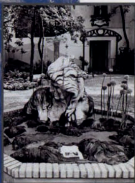
Boduognat voor de tweede keer geveld. De buste bij een vijvertje in de Antwerpse Zoo

Belgen worden dank zij Ambiorix koene Eburontelgen. Hoe onverschrokken en krijgshaftig deze vorst zich in 54 voor Christus tegenover de Romeinse legers heeft opgesteld, moet blijken uit de sculptuur van de Franse beeldhouwer Jules Bastin, die later ook voor de stad Saint Denis een gelijkaardig maar tijdens de oorlog vernield beeld van Vercingetorix bedacht. Onder druk van de Tongerse gemeenteraad en het oudheidkundig genootschap moet Bastin de oorspronkelijke maquette voor zijn Ambiorix meerdere malen wijzigen.