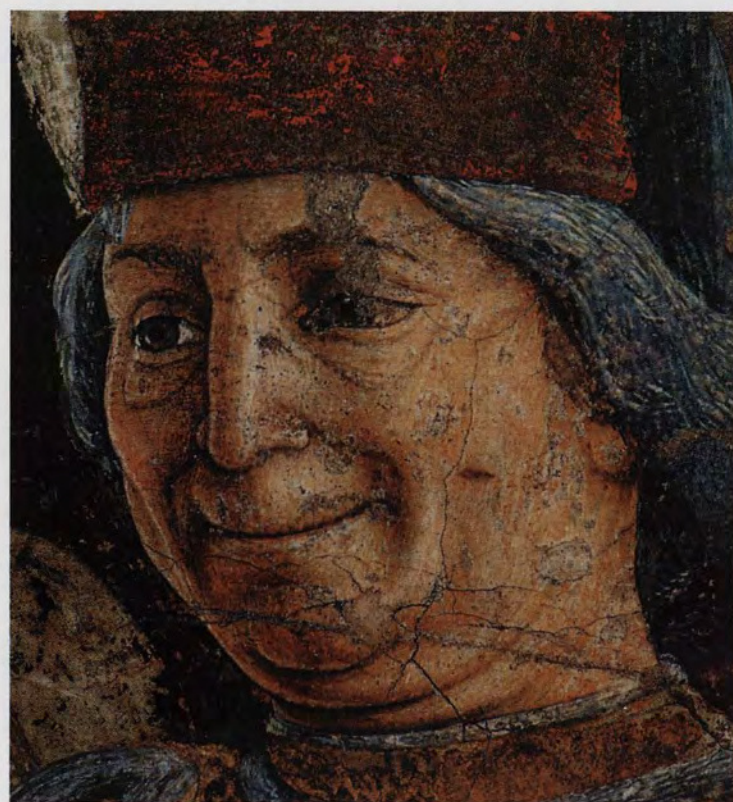
Borso d'Este op fresco in Palazzo Schifanoia

Drie prinsen, drie broers, Lionello (1441-1450), Borso (1450-1471) en Ercole (1471-1505), stimuleerden in Ferrara en zijn heerlijkheid gedurende een zestigtal jaren een hofcultuur die een der merkwaardigste hoofdstukken vormden van het humanisme en van wat doorgaans (maar deze term is hier wellicht niet volledig geschikt) de renaissance wordt genoemd. De hofcultuur van de Este is steeds een dynamische cultuur geweest.