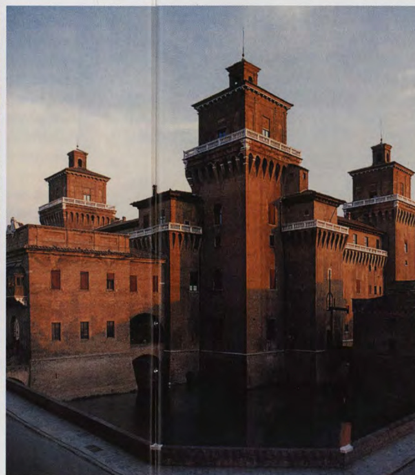
Castello Estense, Ferrara