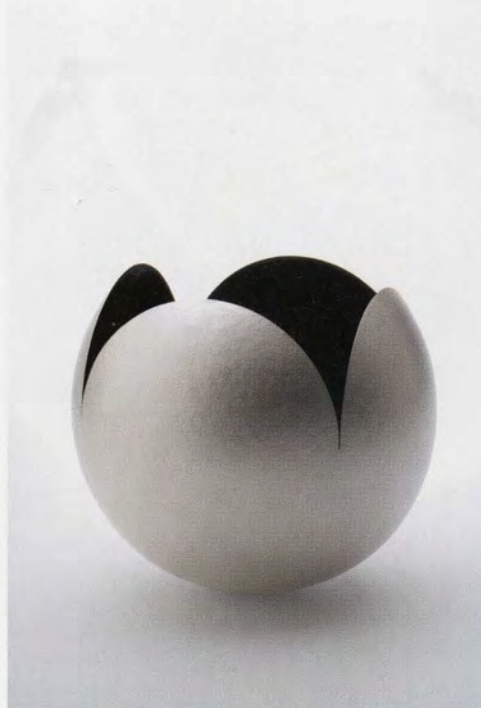
Square Flower 2004 Zilver 925/1000 Diameter 17 cm x 14 cm