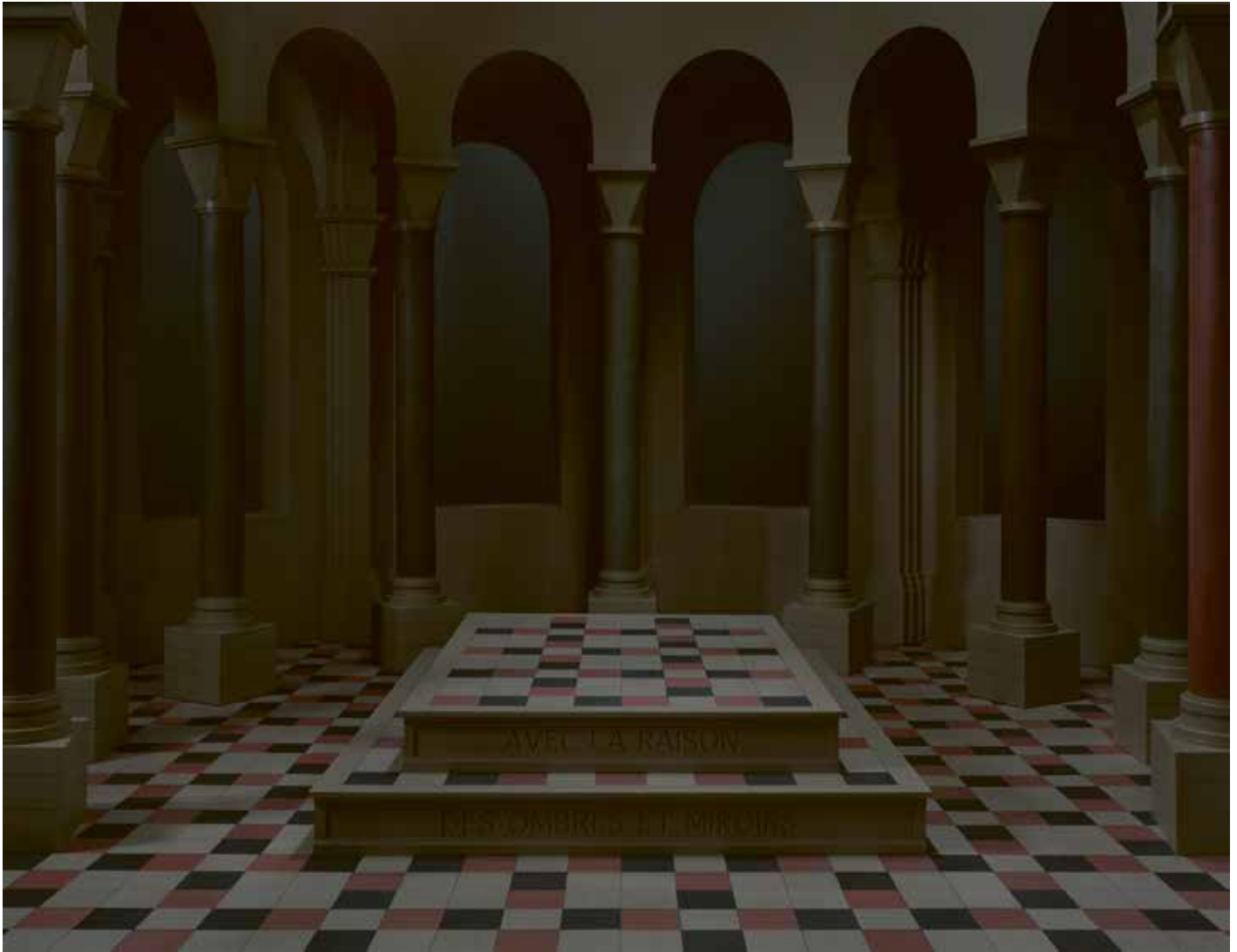
Lieven Lefere, La raison des miroirs , 2020