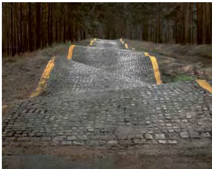
Lieven Lefere, Road , 2012