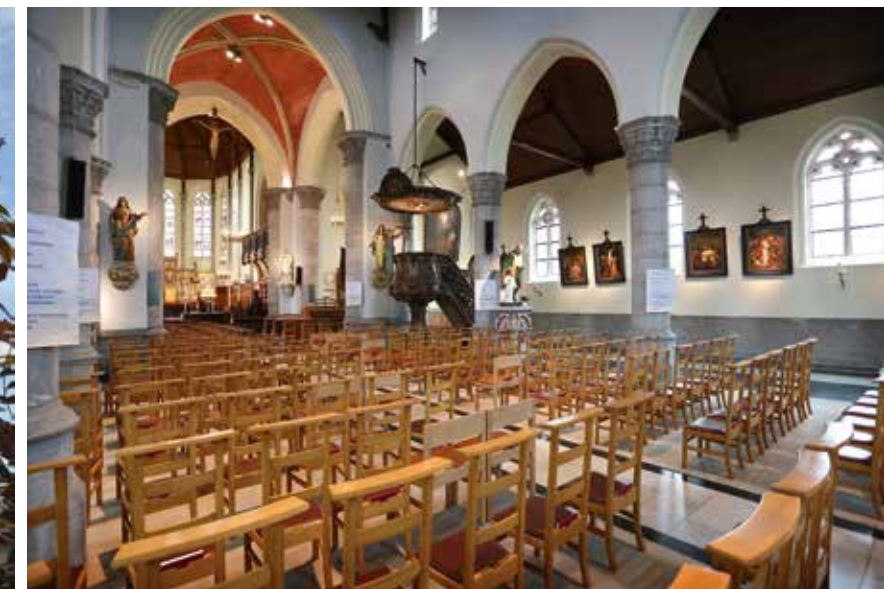
Het interieur van de Sint-Petrus en Sint-Pauluskerk