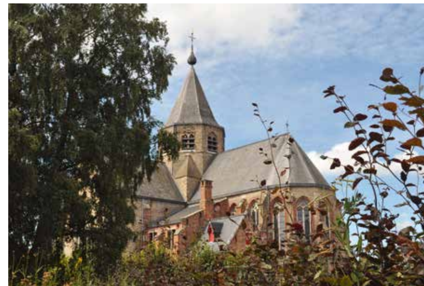
De Sint-Petrus en Sint-Pauluskerk in Middelburg werd ingewijd in 1460

Het huidige Middelburg in het Meetjesland dankt zijn naam aan de abdij van Middelburg in Zeeland. Pieter Bladelin verwierf een flinke oppervlakte aan drassige gronden van deze abdij en hij besloot om hier een nieuwe haven te bouwen. Hij stichtte zijn stad tussen 1445 en 1450 en voorzag haar van alle benodigdheden: marktpleinen, een stadhuis, kanalen en een kasteel. Na dit ‘ab urbe condita’ vierden de Middelburgers de inwijding van hun Sint-Petrus en Sint-Pauluskerk in 1460. Niemand minder dan Jean Chevrot, bisschop van Doornik en vertrouweling van Filips de Goede, kwam de tempel inwijden. Ook kerken bouwde men toen op de groei: men begon met het koor, de toren en de dwarsbeuk, het schip kon later naar believen nog verlengd of zelfs verbreed worden. Het huidige schip dateert overigens van een restauratieperi-