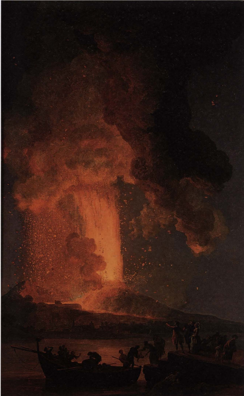
Boven: Jacques Antoine Volaire (1729-1802), Vesuvius MUSÉE MUNICIPAL DES BEAUX-ARTS, BREST