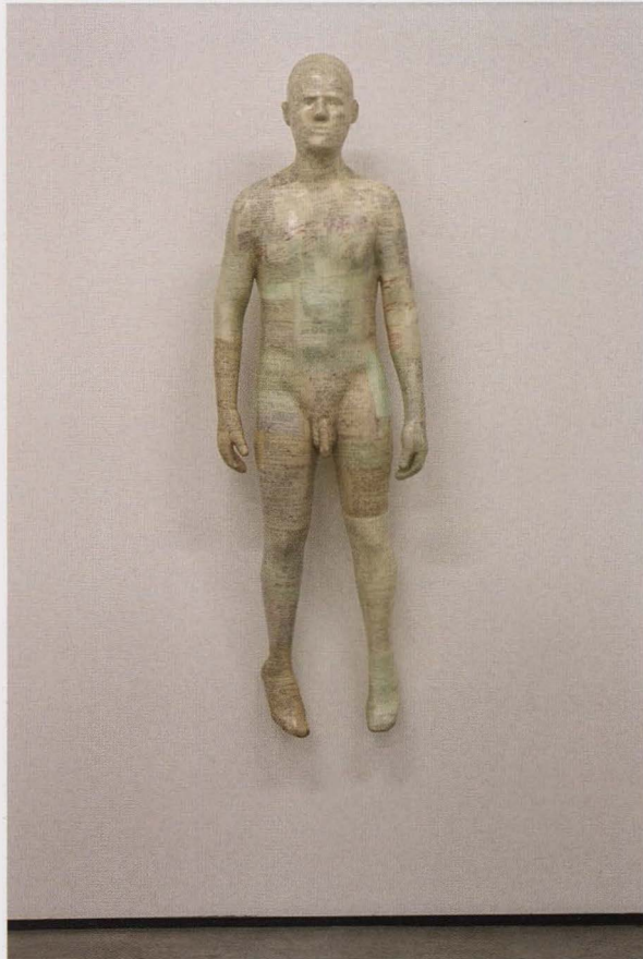
Anti Master (hangende sculptuur), 2003, 190 x 45 x 40 cm

dan ook de titel van zijn eerste overzichtstentoonstelling in 1997 in het inmiddels verdwenen Museum voor Schone Kunsten van Oostende. Hier werd al duidelijk dat Velter stilaan de streng technisch-mechanische werken achter zich had gelaten voor werken waarin – ik citeer hier Hugo Brutin – “vorm en gedachte, illusie en werkelijkheid, het gestructureerde en de vrije vorm elkaar uitbundig aanvullen en uitdagen.”