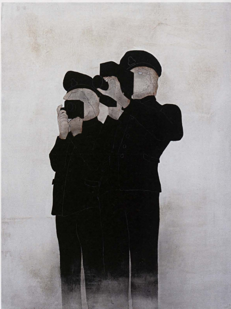
Recording Utopia, 2007, 130 x 100 cm