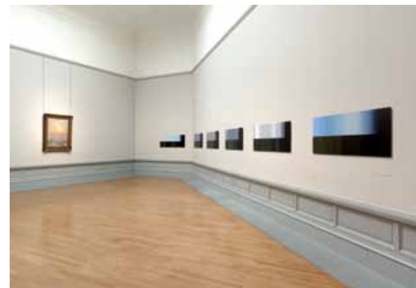
Zaalzichten 'Sunset / Sunset', 2010, MUSEUM VOOR SCHONE KUNSTEN, GENT