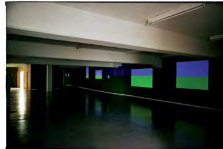
Zaalzicht 'Ohne Titel', 2006, KUNSTVEREIN, AHLEN (DUITS- LAND)