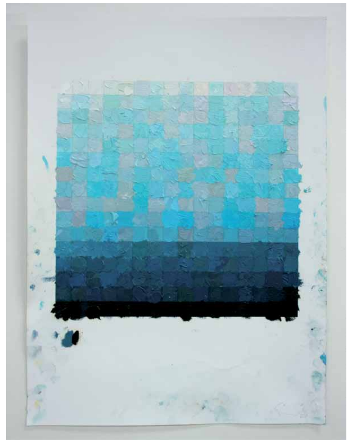
Found Footage / colorscape, 2009, olie op inkjetprint