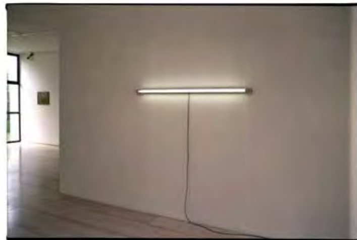
Zaalzichten 'Picture this!', 2006, MUSEUM DHONDT DHAENENS, DEURLE