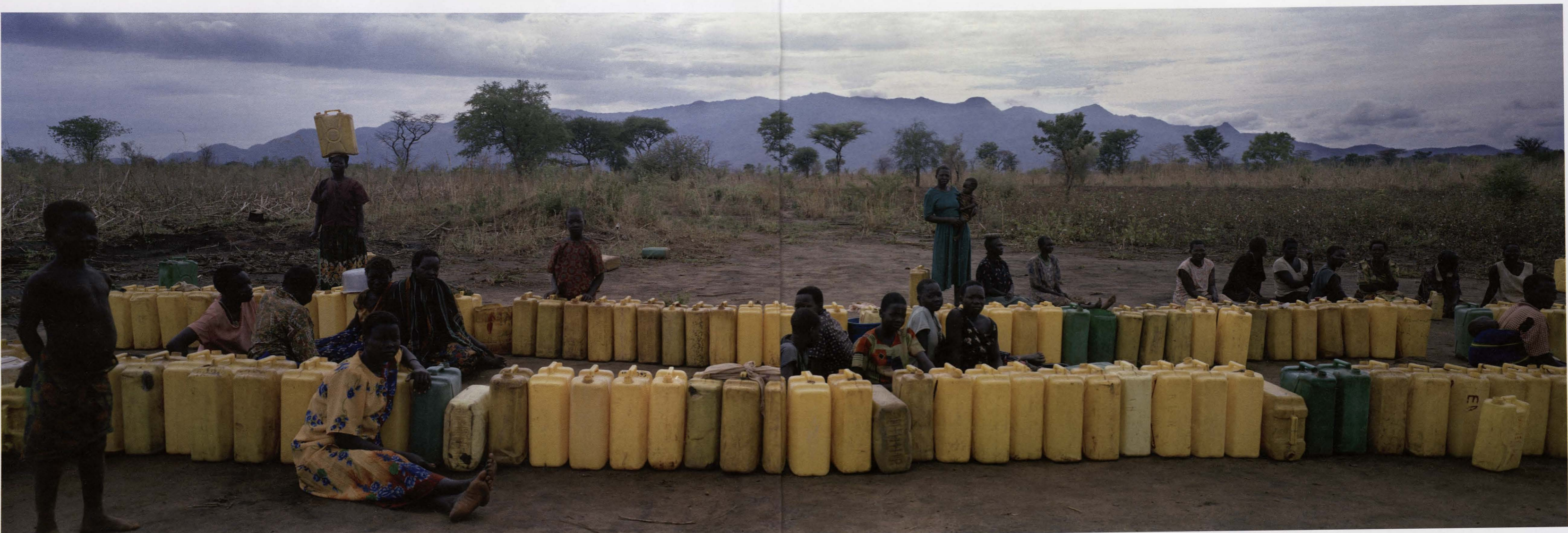
Tableaux de Guerre Oeganda, Orom-vluchtelingenkamp, 2005