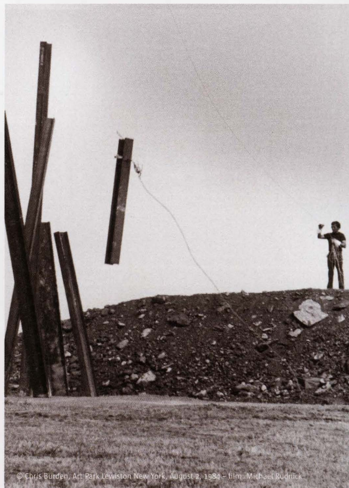
© Chris Burden, Art Park Lewiston New York, August 2, 1984 - film - Michael Rüdnick