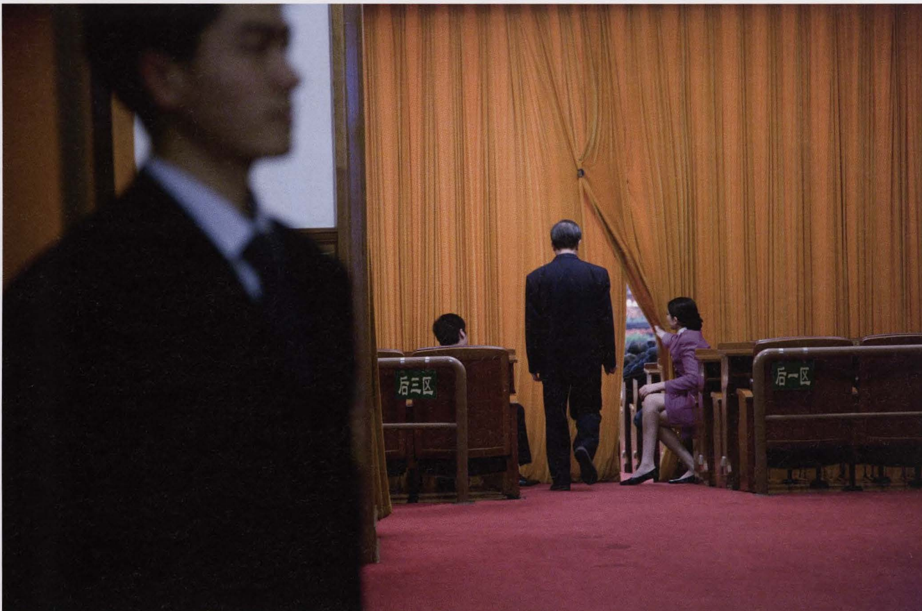
Tableaux Politiques China, de grote Hall in Peking