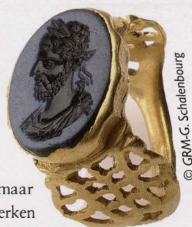
Gouden ring Commodus

of godenbeelden lijkt dat niet onlogisch, maar hier gebeurt dat ook met een reeks aardewerken potten op een legplank. Benieuwd wat de archeologen daar van denken.