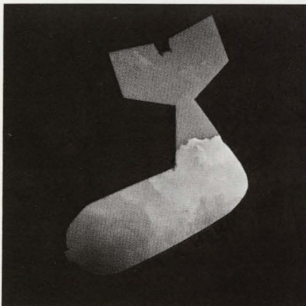
Our friendly bombs, New York, 1972.

Die koninklijke afscheidskus betekende echter niet het einde. Door de Fabiola-figuur wordt Van den Berghe mateloos geïrriteerd. Een poosje heeft hij al haar foto's uit de kranten geknipt en aan zijn muren gehan-