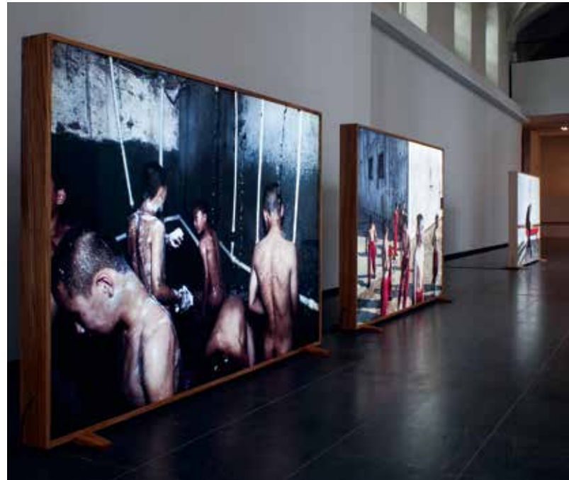
Zaalzicht van de solotentoonstelling Blue, See Mount Song Los Domadores , 2015, CAERMERSKLOOSTER, GENT