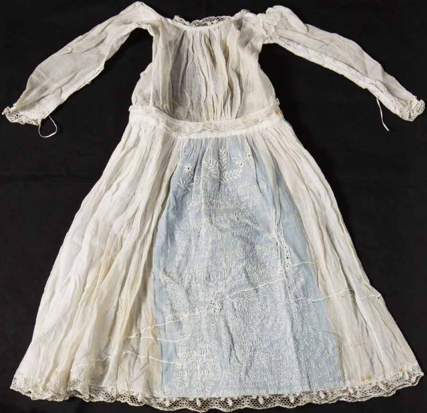
Anoniem, Kinderjurk, 1840-1860, katoen, zijde, Basiliek van Onze-Lieve-Vrouw van Scherpenheuvel