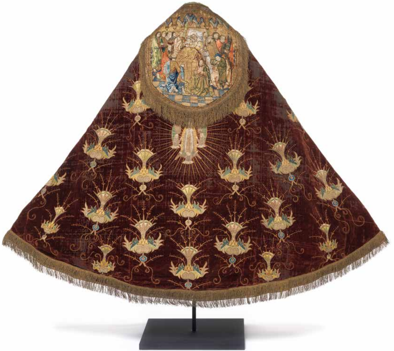
Anoniem (Engeland), Koorkap van Nonnemiël , ca. 1500, rood zijdefluweel, linnen, glasparels, zilver- en gouddraad, Collectie Stad Antwerpen, MAS, Collectie Stad Antwerpen