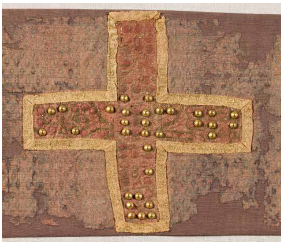
Casula en velamen van de heiligen Harlindis en Relindis (detail)