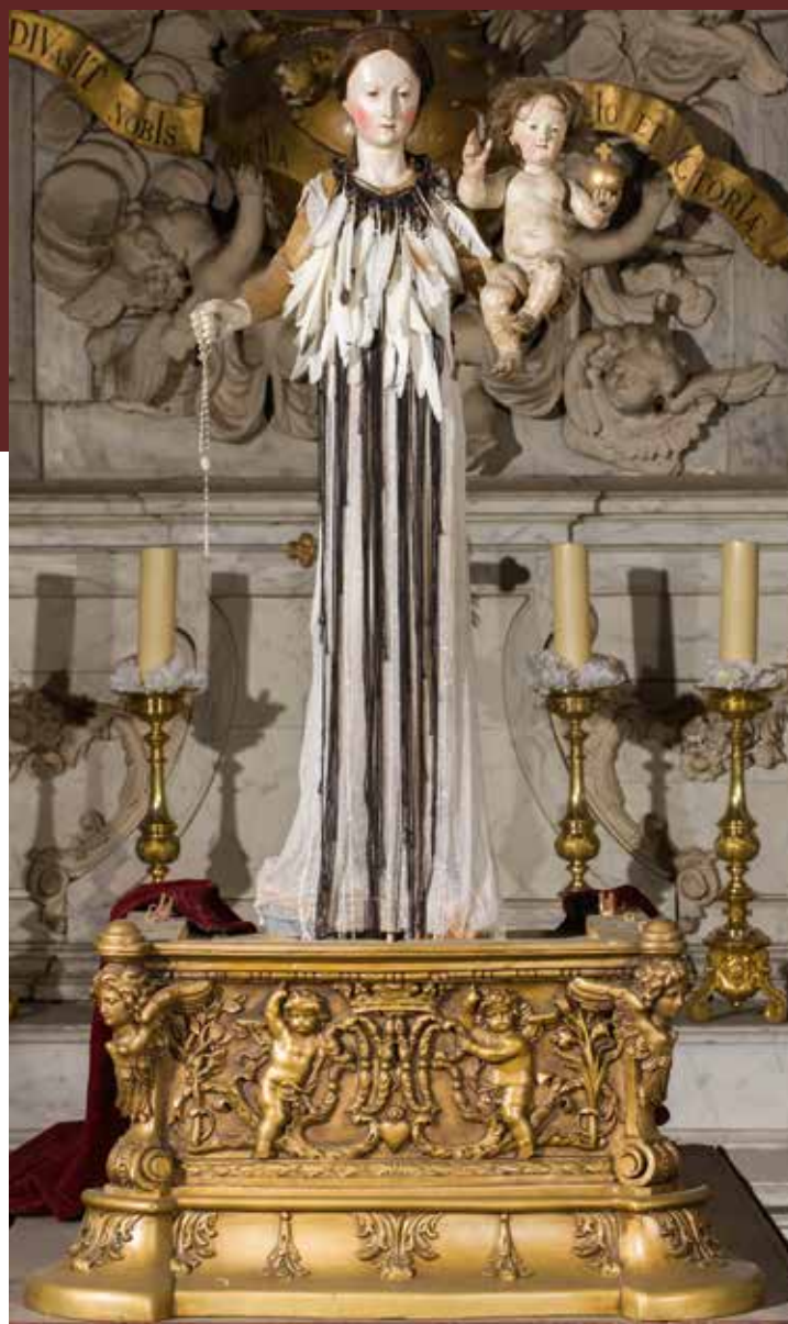
Ann Demeulemeester, Mantel Onze-Lieve-Vrouw van Bijstand en Victorie, 2001, Sint-Andrieskerk, Antwerpen

Luxeuze paramenten worden in de liturgie nu minder gebruikt. Maar we kennen allemaal wel de Mariabeelden met hun gewaden en juwelen, dikwijls nog aangevuld met kleertjes voor het kind Jezus. In de Sint-Andrieskerk in Antwerpen vind je het beeld van Onze-Lieve-Vrouw van Bijstand en Victorie. Voor de Mariafiguur en voor het Jezuskind met zwierige lokken is er vanaf de achttiende eeuw een hele garderobe aangelegd met kledingstukken en brokaten mantels voor alle gelegenheden (feestdagen, processies). In 2001 creëerde modeontwerpster Ann Demeulemeester (1959) nog een nieuw gewaad voor het Mariabeeld, in zijde en veren. Voor zover wij weten, een zeldzaam voorbeeld van een hedendaagse couturier die religieus erfgoed maakt.