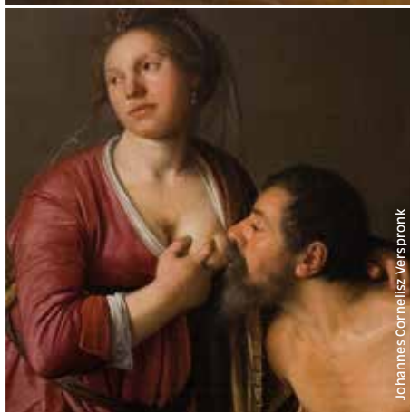
Johannes Cornelisz. Verspronk