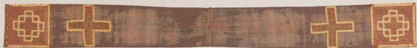
Anoniem, Casula en velamen van de heiligen Harlindis en Relindis , 750-850, kralen, linnen, zijde, parel, 232 x 25,5 cm, Schatkamer van de Sint-Catharinakerk, Maaseik