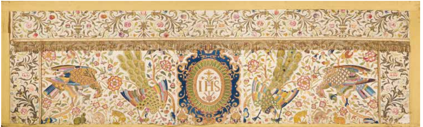
Anoniem, Antependium met Chinees borduurwerk, 1650-1700, zijde, Sint-Carolus Borromeuskerk, Antwerpen