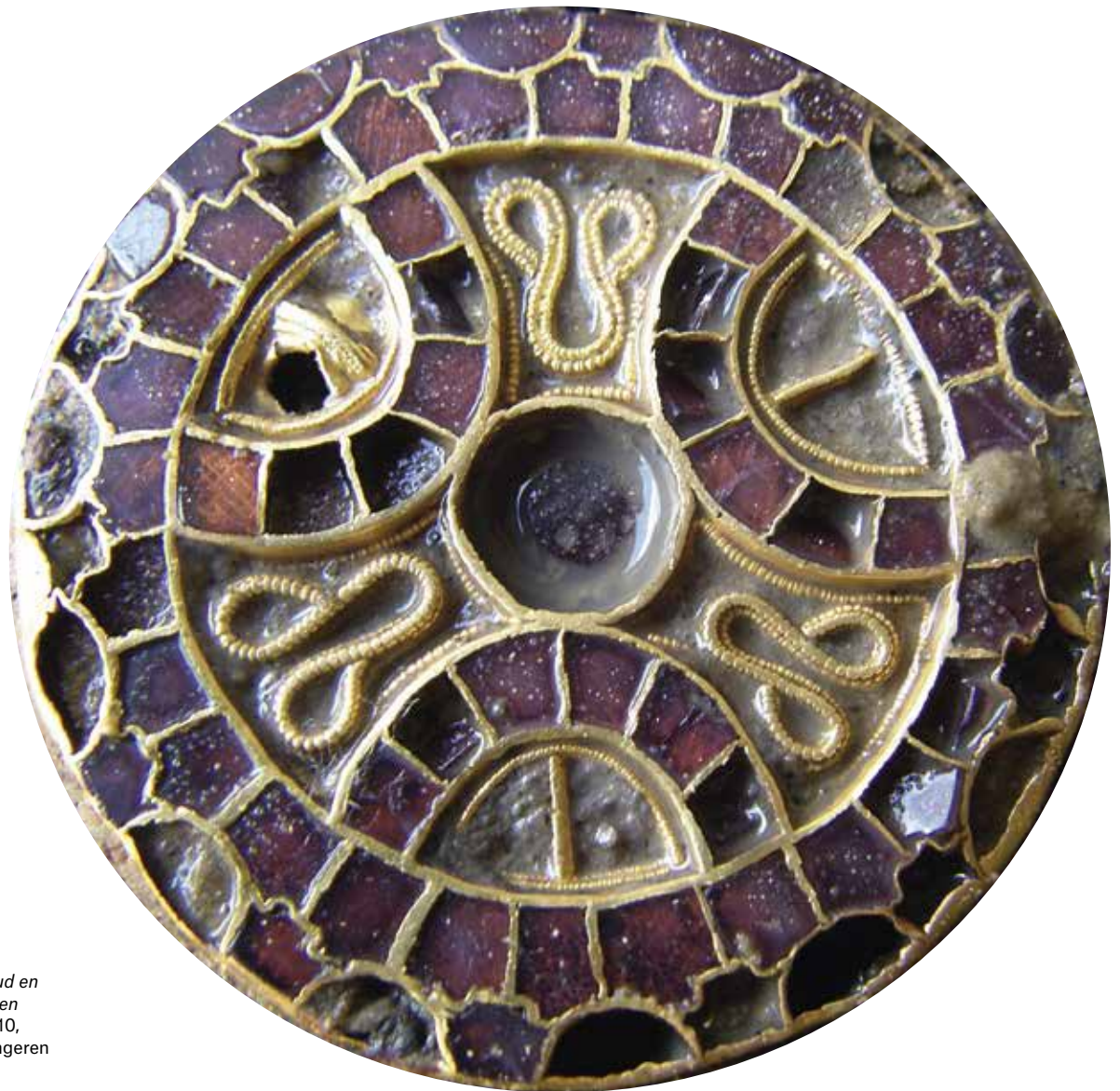
Broechem, Schijffibula in goud en zilver met filigraanversiering en ingelegd met granaat , 560-610, Gallo-Romeins Museum, Tongeren

afgebroken. Zijn Van der Paele Madonna gedijde ook in die kerk. Het is een zogenaamde memorietafel, of een schilderij om de gedachtenis aan een persoon, in dit geval kanunnik Joris van der Paele, levendig te houden.