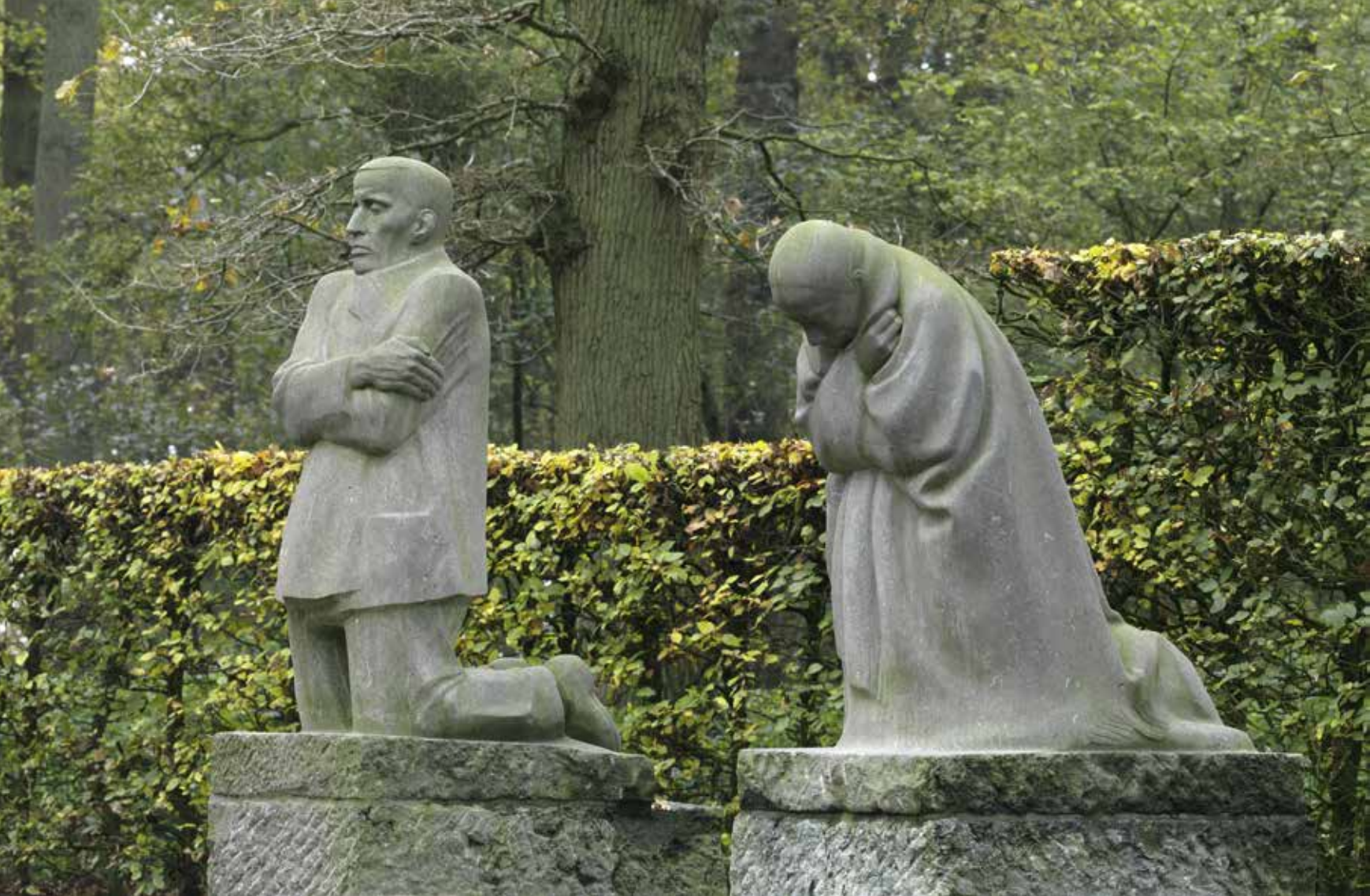
Käthe Kollwitz, Treurend ouderpaar, 1927-1932, graniet, Duitse militaire begraafplaats, Vladslo