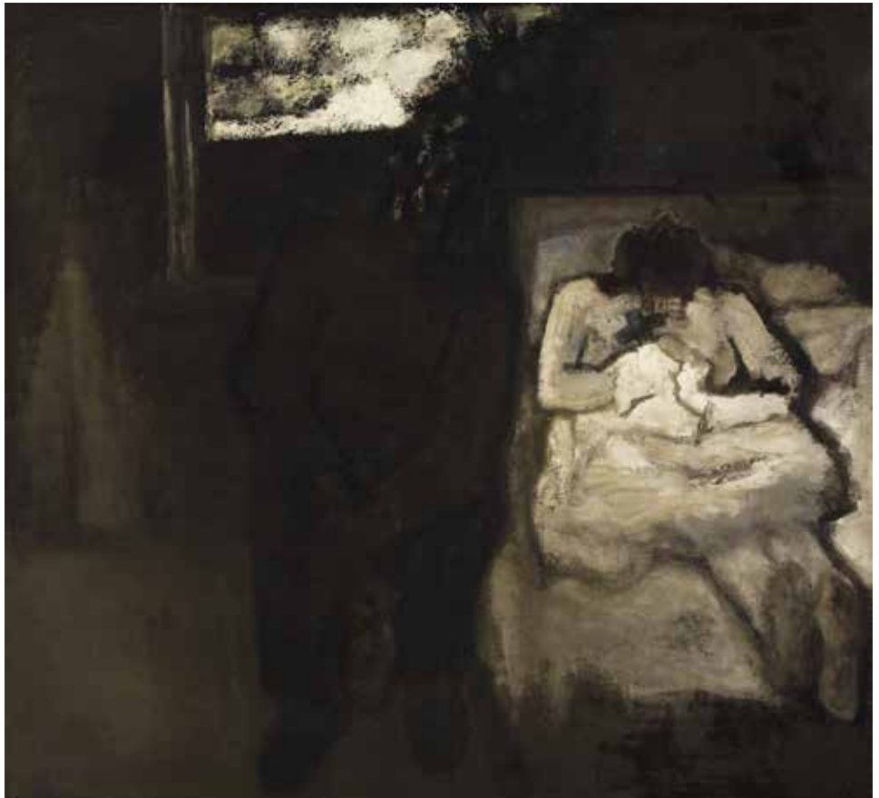
Constant Permeke, Het afscheid , 1948, olieverf op doek, 163 x 178,5 cm, Mu.ZEE, Oostende

Het kan ook subtieler zoals in de Dood van Maria van Hugo van der Goes (ca. 1440-1482/83). Van der Goes legde al zijn vernuft in deze sterfscène, met apostelen met elk afzonderlijk een eigen gevoelsleven. Ze treuren in groep, maar zijn individueel geraakt door het verlies van een geliefde. Van der Goes munt niet enkel uit door zijn precieze schilderkunsten, maar weet mensen van alle mogelijke gezindten, vijf en een halve eeuw na datum, te ontroeren.