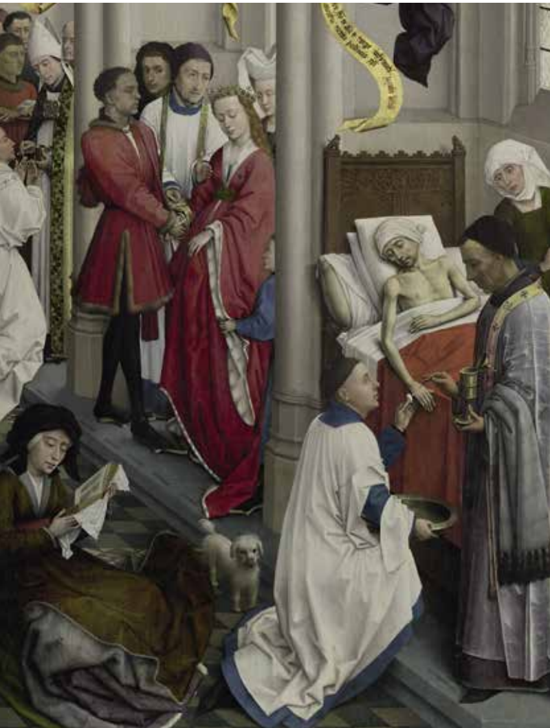
Rogier van der Weyden, De zeven sacramenten (detail), 1440-1445, olieverf op paneel, 200 x 223 cm, Koninklijk Museum voor Schone Kunsten, Antwerpen

Kunsliefhebbers kijken doorgaans met veel bewondering naar het gedetailleerde interieur van de gotische kerk en de vele handelingen, mensen en de occasionele hondjes, naast de ziel-togende, gekruisigde Christus in Rogier van der Weydens (ca. 1400-1464) Retabel met de zeven sacramenten . De kern van het verhaal, naast de opvoering van de kerk als instituut, is nochtans de dode man aan het kruis, tegen de gewelven aan, reikend naar de hemel en zijn vader. Maria en de andere figuren zijn erg aangedaan. Het is Van der Weydens visitekaartje als meester van de emotie, met lichamen die lijden en compassie uitdrukken en gezichten vertrokken van pijn. Rechts in een zijkapel krijgt een stervende man het laatste sacrament, het heilig olie, toegediend. Zijn gelaat is precies een echo van dat van Christus.