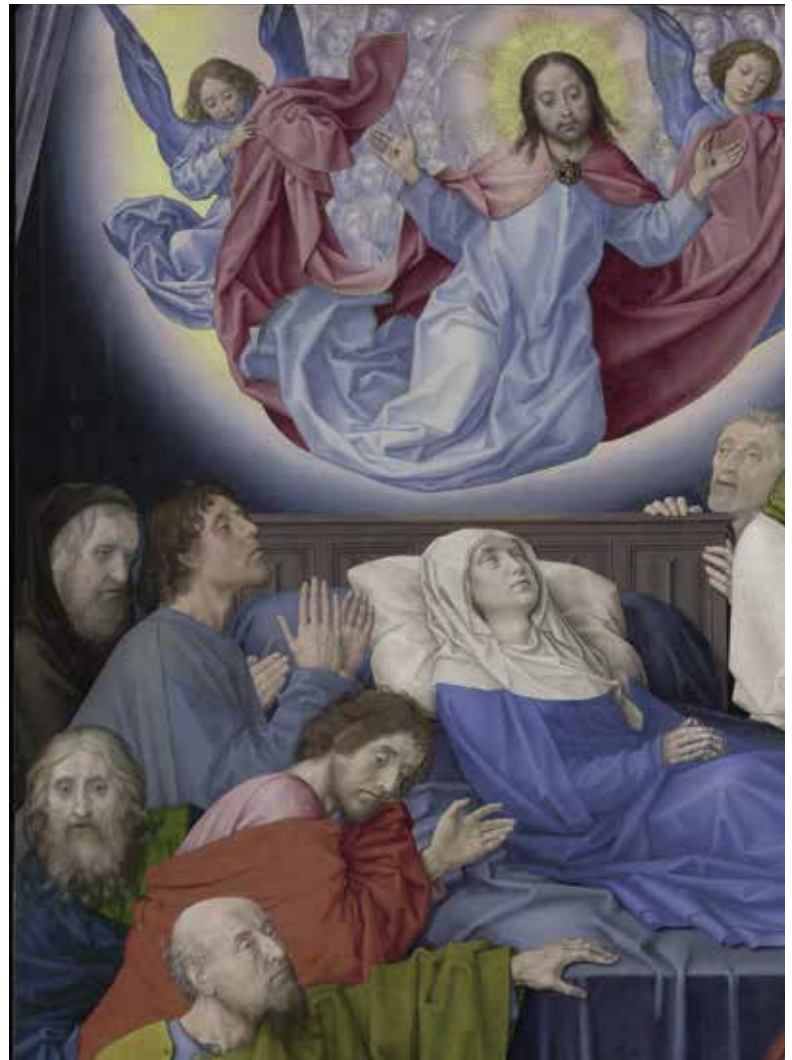
Hugo van der Goes, Dood van Maria (detail), 1475-1482/83, 147,8 cm x 122,5 cm, olieverf op paneel, Groeningemuseum, Musea Brugge

Zeker in een museale context lijken we toch meer naar de techniek en de kleuren van de meester uit Doornik te kijken dan dat we geraakt worden door de wijze waarop de verhaalsstof verbeeld werd. Net zo bij de graflegging in Quinten Massijs' Altaarstuk van het schrijnwerkersambacht . Al is dat ook persoonsgebonden. Pas toen mijn vijfjarige dochter in het Musée Unterlinden in Colmar een dode Christus zag, drong het weer tot me door wat de afschrikwekkende kracht van een dergelijk beeld kan zijn. Zij kende Christus niet, zag een persoon die heel erg pijn leed, begreep niet waarom een mens aan een houten kruis genageld was. En toen moest ze nog de Christus van Matthias Grünewald (1470-1528) aanschouwen in zijn Isenheim altaarstuk , met misvormde ledematen en duizend splinters in een lijf smachtend naar de dood.