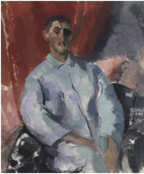
Rik Wouters, Zelfportret met de zwarte ooglap , 1915, olieverf op doek, 102 x 85 cm, Koninklijk Museum voor Schone Kunsten, Antwerpen