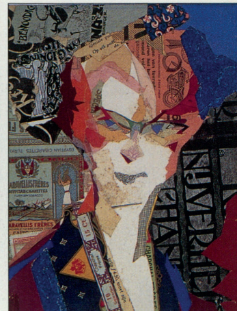
ALIDA POTT, PORTRET KMSK, ANTWERPEN