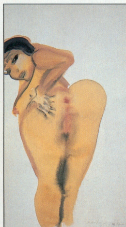
MARLENE DUMAS, MANDY, 1998