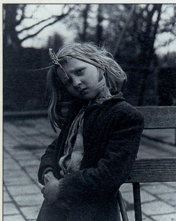
EMMY ANDRIESSÉ, AMSTERDAM, 1951 FOTO: EMMY ANDRIESSÉ