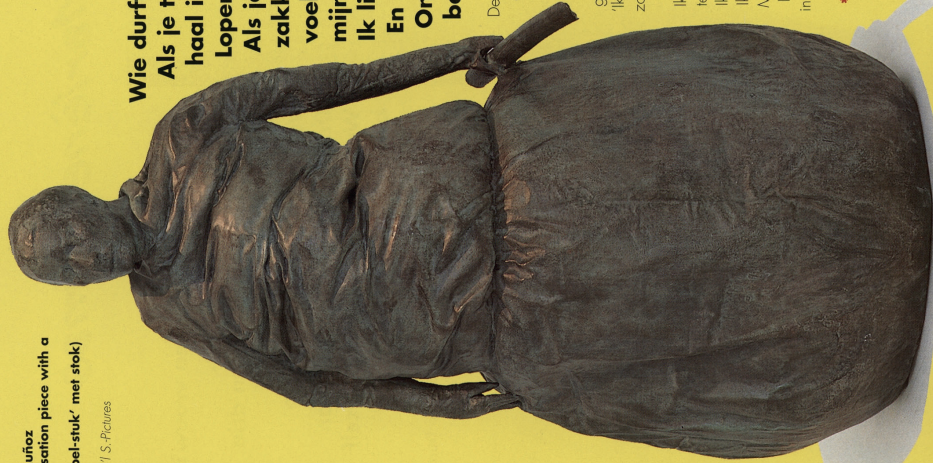
Juan Muñoz Conversation piece with a stick (='babbal-stuk' met stok) 1994