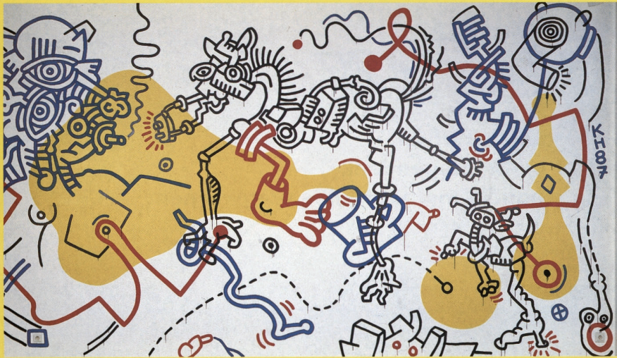
Keith Haring Zonder titel 1987