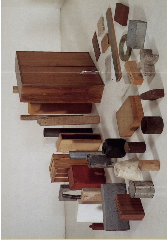
Tony Cragg Spirale (spiraal, krullijn) 1983