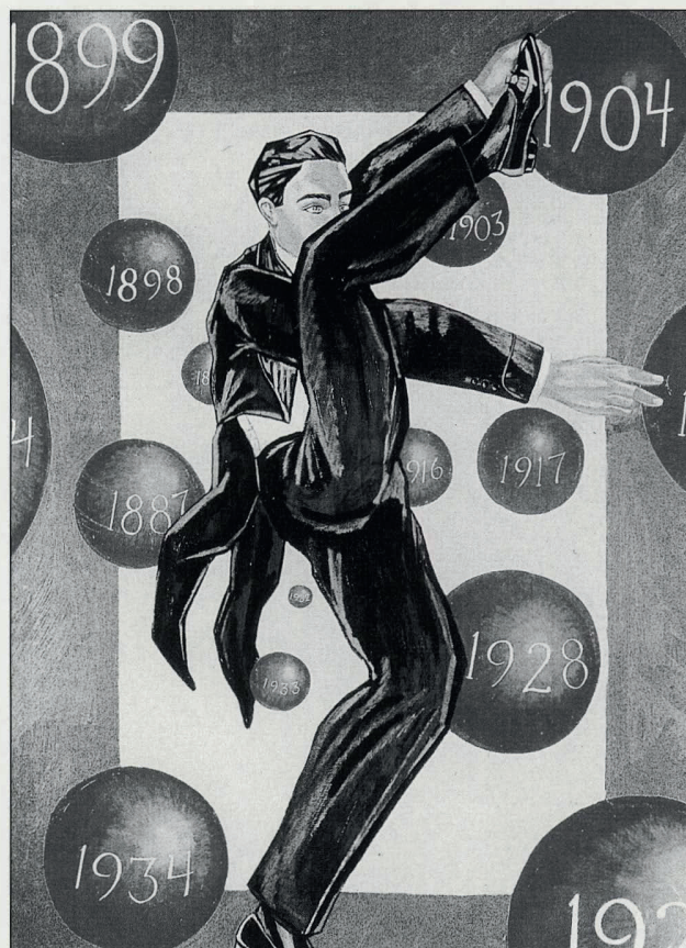
McDermott en McGough, Time Balls - 1921, (1988), Olieverf op doek, 130 x 110 cm

Het werk van David McDermott (°1952 Hollywood, California) en Peter Thomas McGough (°1958 Syracuse, New York) kan worden beschouwd als een tijdsexperiment dat zich in New York City en (momenteel) in Dublin afspeelt. Het medium waarin zij zich uitdrukken is in feite drievoudig: olieverfschilderkunst, glasplaatfotografie en het leven zelf. McDermott en McGough hebben voor een leven als anachronisme gekozen. Onder het motto 'All time exists at the same time' leven zij in het verleden. In Hudson Valley verplaatsten ze zich met paard en kar, als was het in de 18de eeuw. In Brooklyn hadden ze hun atelier, een bankgebouw, waar ze werkten zoals in 1920. 's Avonds leefden ze in hun huis in de East-Side waar de klok werd teruggedraaid naar 1880.