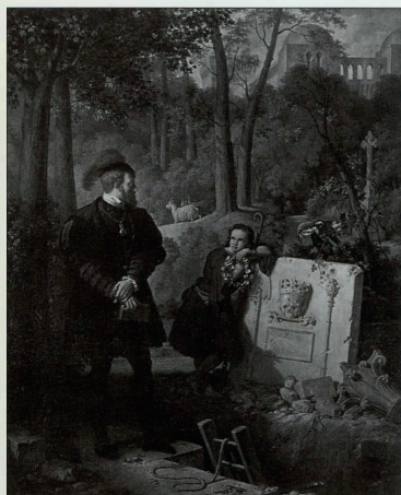
PIERRE REVOIL, KEIZER KAREL IN DE ABDIJ VAN YUSTE, 1836 OLIEVERF OP DOEK, 81 X 66 CM © AVIGNON, MUSÉE DE CALVET

met OKV-Museumkaart reductie: 50 i.p.v. 100 BEF