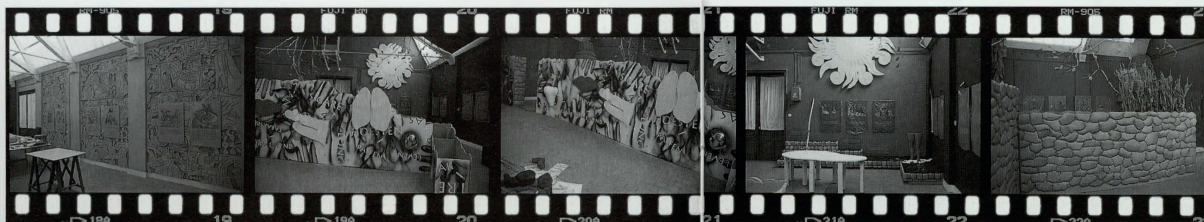
GEZICHT OP DE TENTOONSTELLING 'TIERRA-TIERRA'