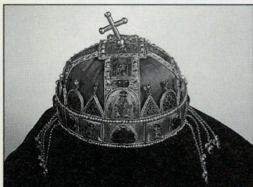
SINT-STEFANUSKROON, 11DE EEUW MAGYAR NEMZETI MUZEUM, BOEDAPEST