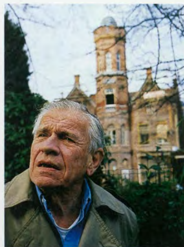
Nederlands' grootste volksschrijver