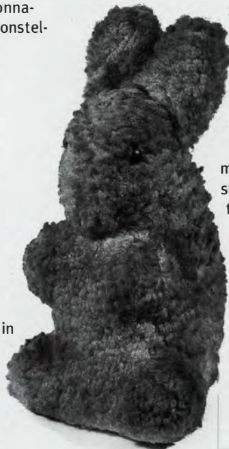
Het konijn uit 'de Avonden', © Letterkundig Museum, Den Haag

Een logisch geheel maken van al het verzamelde materiaal kan geen eenvoudige opdracht geweest zijn. Er zijn nl. ontelbare kleine dingetjes. Alleen door een zorgvuldig arrangement en een goed doordachte vormgeving konden Nop Maas en Wim Crowwel erin slagen alles te kaderen in een totaalbeeld dat de gemiddelde bezoeker gedurende een tweetal uur kan blijven boeien. Echte Reve-fanaten, voor wie deze tentoonstelling wel een feest moet zijn, trekken er best nog wat meer tijd voor uit. Natuurlijk kan men ook alleen even de sfeer opsnuiven, de topstukken langslopen, of als lezer nu wel eens de personen en locaties die in Reves boeken voorkomen en voor deze gelegenheid in het Letterkundig museum gevisualiseerd zijn, bekijken.