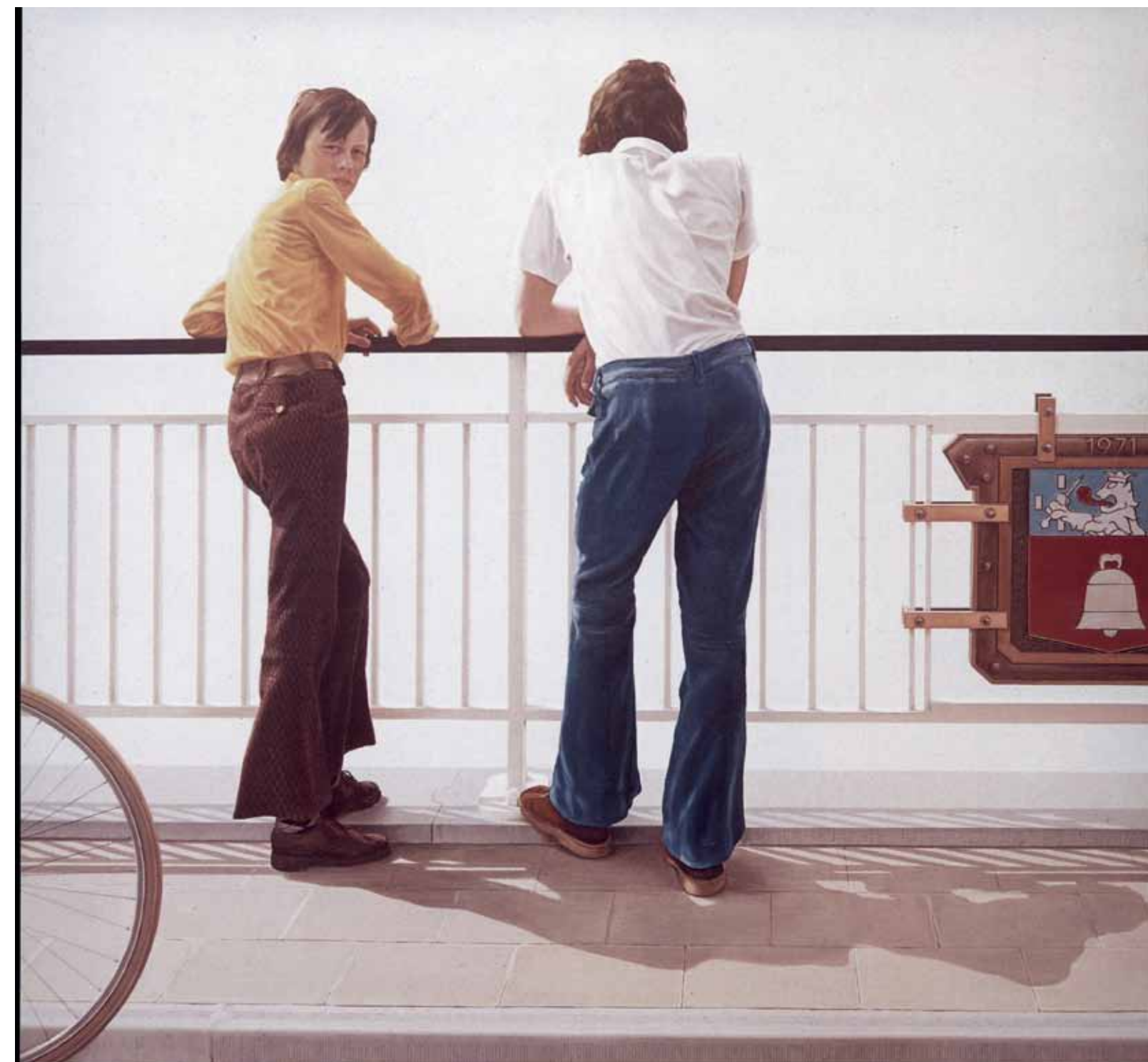
Antoon De Clerck Wat een drukte op de E 5 Schilderij op doek S.M.A.K. GENT