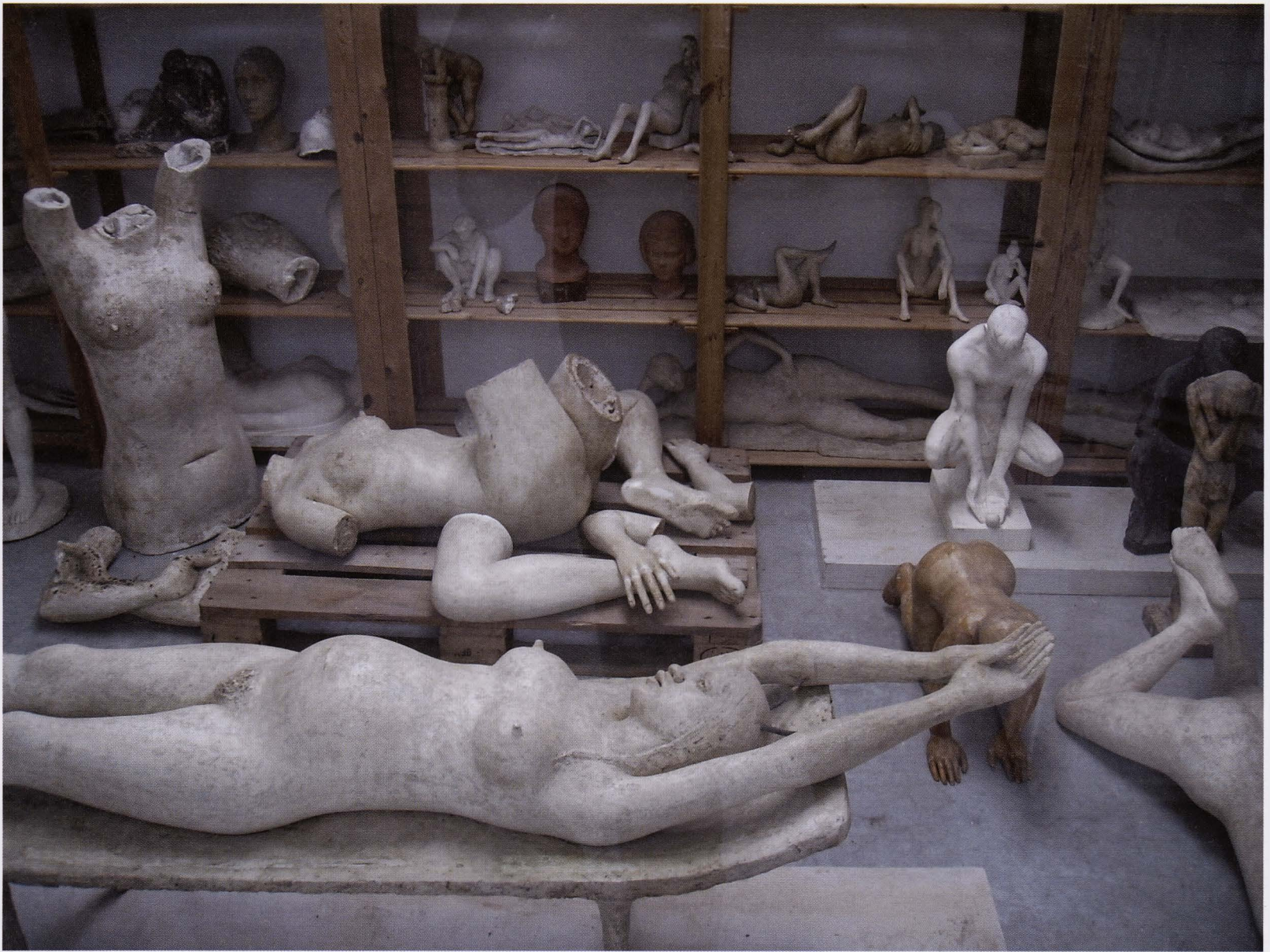
De 'reserve' van het Museum George Grard