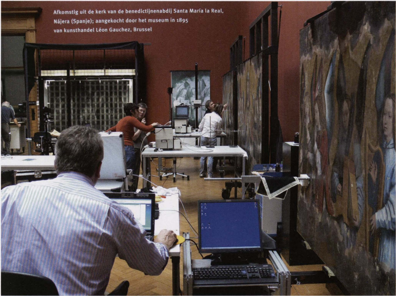
Afkomstig uit de kerk van de benedictijnenabdij Santa María la Real, Nájera (Spanje); aangekocht door het museum in 1895 van kunsthandelaar Léon Gauchez, Brussel