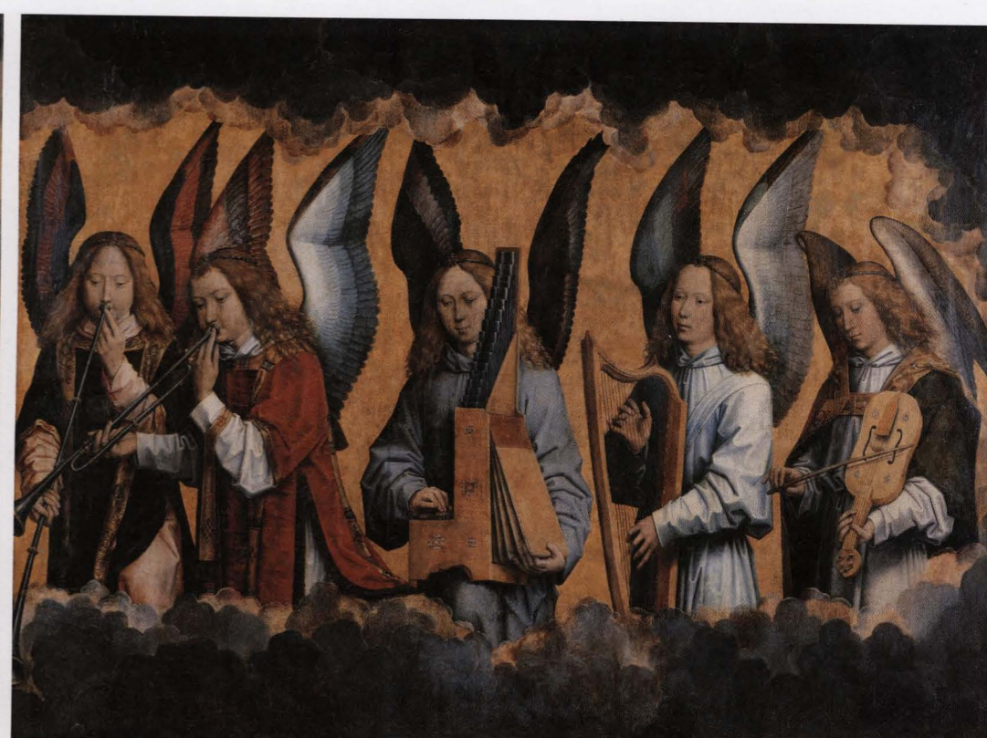
Hans Memling, Christus met zingende en musicerende engelen, olieverf op paneel, 165 x 672 cm KONINKLIJK MUSEUM VOOR SCHONE KUNSTEN, ANTWERPEN